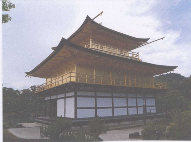
鹿苑寺金閣 (金閣寺)