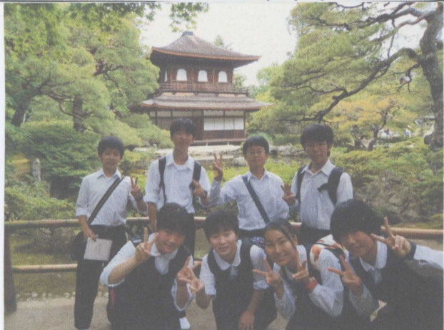
茲照寺銀閣 (銀閣寺)