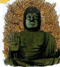
大仏(奈良市東大寺)

●見た瞬間、「デカァー」と思いました。想像していたより大きく、写真や紙では伝わりません。大き、す垂、て腰を抜かすところでした。大仏も大き、かたです。あれを見ると、悪いことができなくなりま、すね。